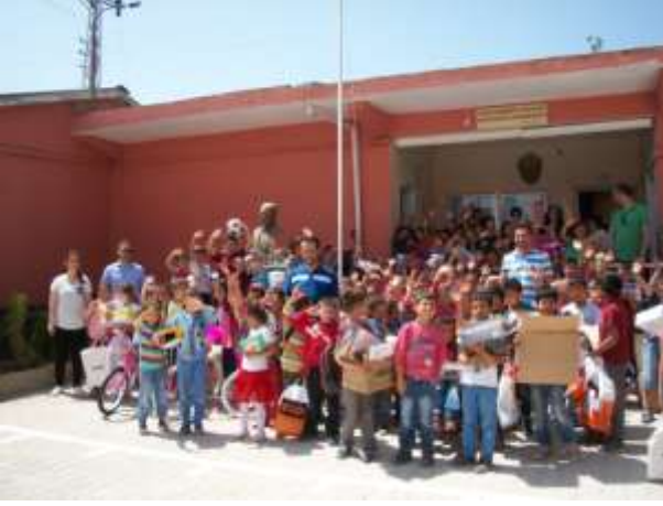
ÖZEL BİR BANKADAN TÜM ÖĞRENCİLERİMİZE OYUNCAK