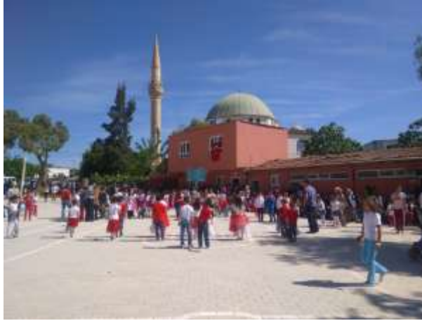
23 NİSAN ŞENLİĞİ