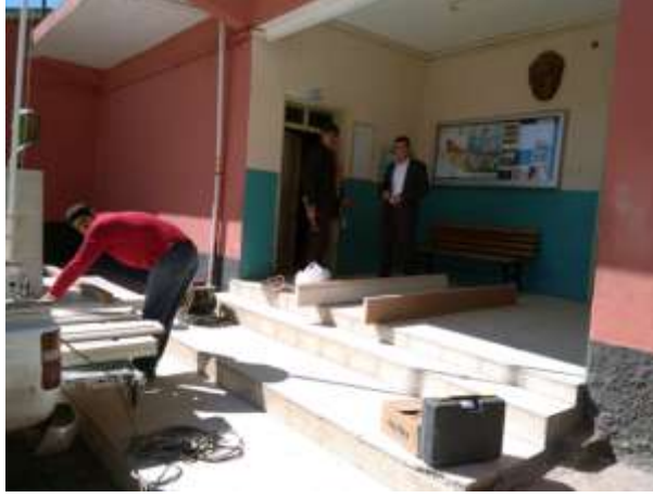
OKULDA KAPI DEĞİŞİMİ