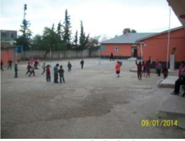
2014 OKULUN GENEL GÖRÜNÜMÜ