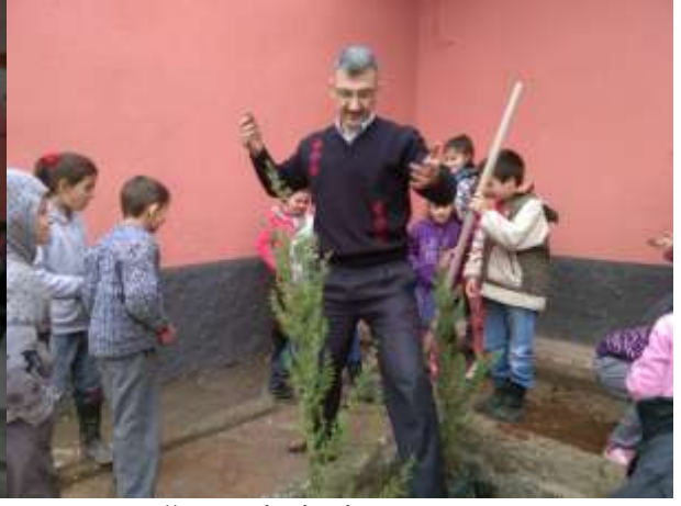
BAHÇEYE AĞAÇ DİKİMİ