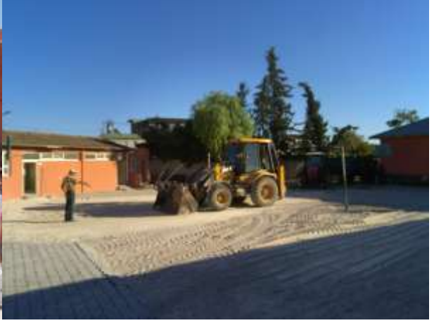
BAHÇE KİLİT TAŞI DÖŞEME