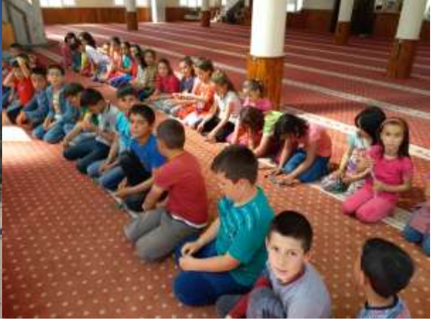
DEĞERLER EĞİTİMİ CAMİDE