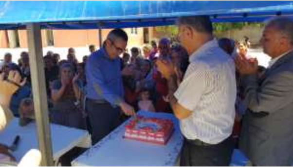
ANNELER GÜNÜ ÖZEL